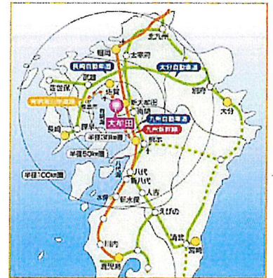
(大牟田市HPより引用)

大牟田市は、福岡県の南部、九州のほぼ中央に位置しています。鉄道や幹線道路、港などの公共交通アクセスも充実しており、九州一円どこへ行くにも便利なまちです。大牟田市は、田舎すぎず、都会すぎず、生活するには便利なものが揃っています。また、子どもから大人まで楽しめる場所や安くても美味しい食べ物が盛りだくさんです。 (大牟田市HPより一部抜粋)